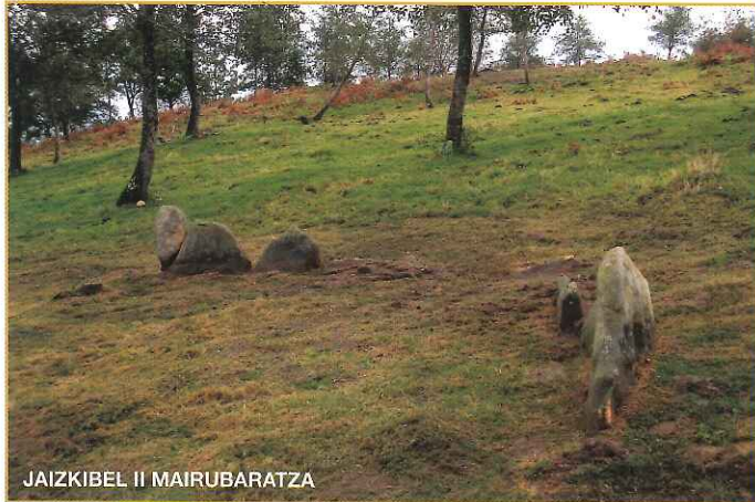
JAIZKIBEL II MAIRUBARTZA