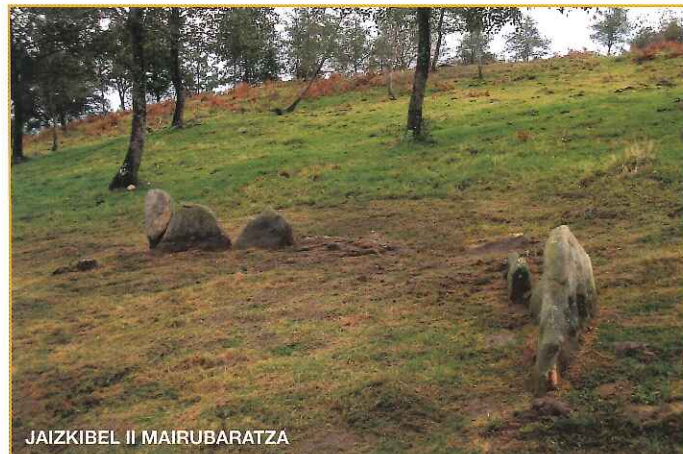
JAIZKIBEL II MAIRUBARATZA