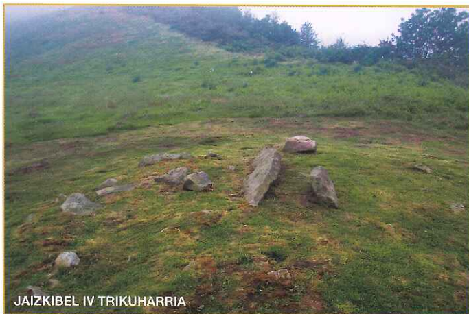
JAIZKIBEL IV TRIKUHARRIA

La Estación Megalítica de Jaizkibel se sitúa en la mitad nororiental de esta sierra, en la línea de cresta y en la vertiente hacia el mar, dentro del término de Hondarrabia. En la actualidad agrupa tres dólmenes y un conjunto de cromlechs pirenaicos.