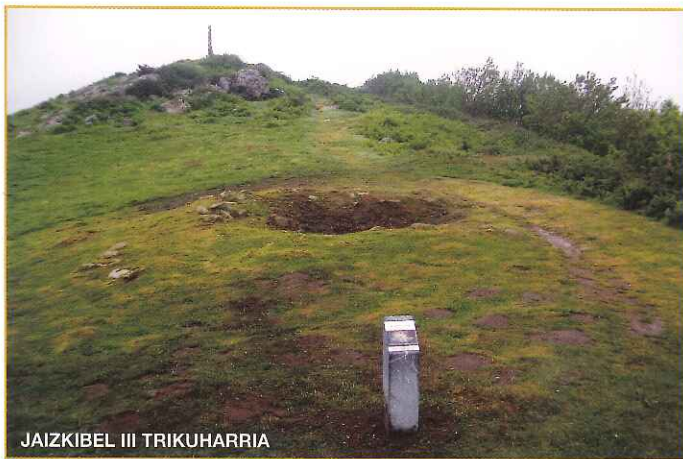
JAIZKIBEL III TRIKUHARRIA