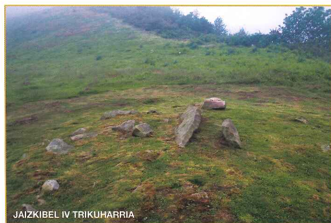
JAIZKIBEL IV TRIKUHARRIA