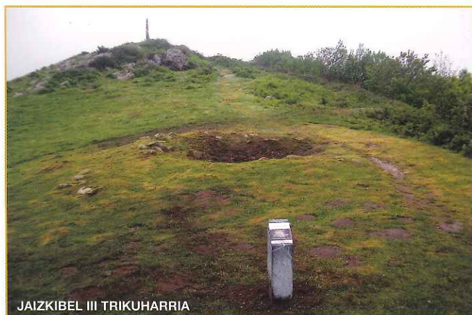
JAIZKIBEL III TRIKUHARRIA

Ondare Monumental hau existitzen dela jakitea ezinbestekoa da gure iraganeko ondarea ulertzeko eta hartaz gozatzeko, bai eta ondare hau behar bezala zaintzeko eta geroko belaunaldiak baldintzarik onenetan helarazten ahalegintzeko ere.