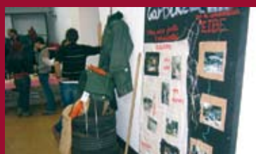
7: UDALTZAINGOA 8: PREVENCIÓN COMUNITARIA