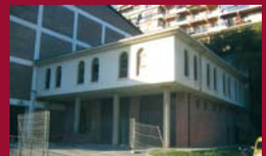
13: EDUCACIÓN 15: EUSKERA