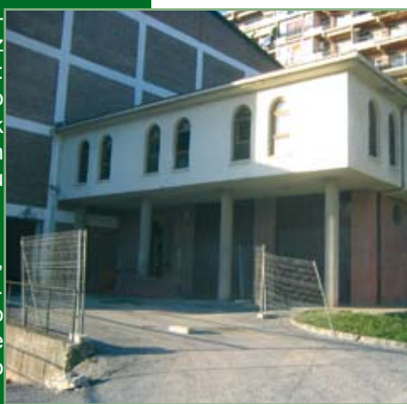
Euskaltegiaren irudi bat

En lo que respecta al Euskaltegi Municipal, el presupuesto será de 242.687 euros. La partida más importante es la de Personal, con 195.800 euros, la de gastos, con 37.000 y otros 2.500 euros para pequeños arreglos en el edificio.