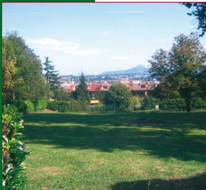
En la fotografía podemos apreciar los terrenos y alrededores donde se construirá la guardería Loraitz