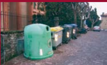
3: PRESUPUESTOS 4-6: URBANISMO Y SERVICIOS

"Aurrekontuen proiektua egiterakoan oso zorrotz jokatu da, gastu arruntak ahalik eta gehien kontrolatuz. Aurrekontu honek 'administrazioko makinaria' behartuko du, aurreko urteetako langile kopuru berdinarekin (kontuan izanik 1. Ataleko gastuak, alegia pertsonal gastuak mantentzeko joera dagoela) iaz baino diru gehiago kudeatu beharko du, 2007ko aurrekontua 2006koa baino %15,50 handiagoa delako" gehitu zuen Kerejetak.