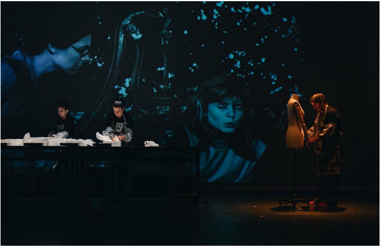
HELEN KELLER, ¿LA MUJER MARAVILLA?