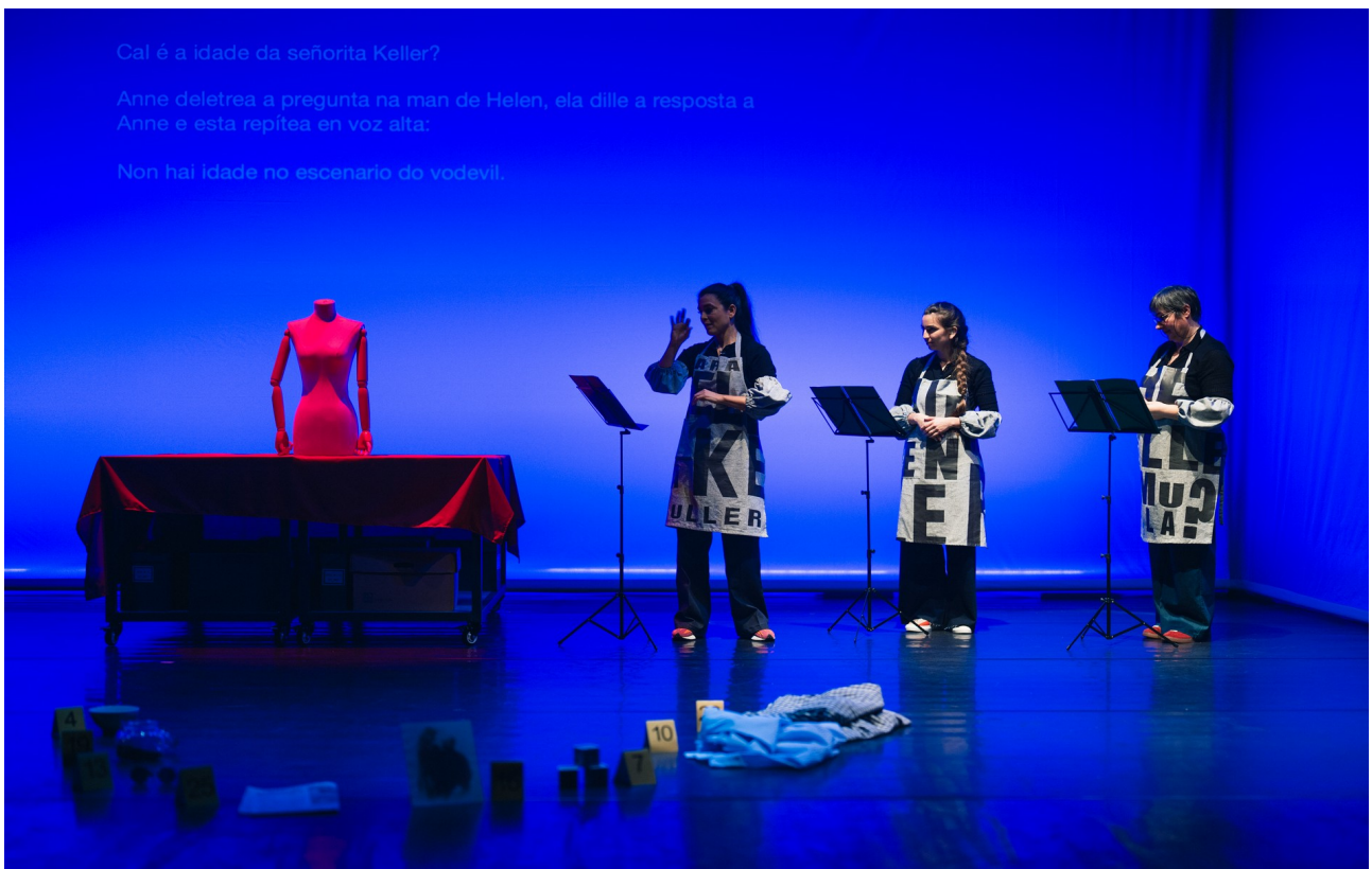
HELEN KELLER, ¿LA MUJER MARAVILLA?