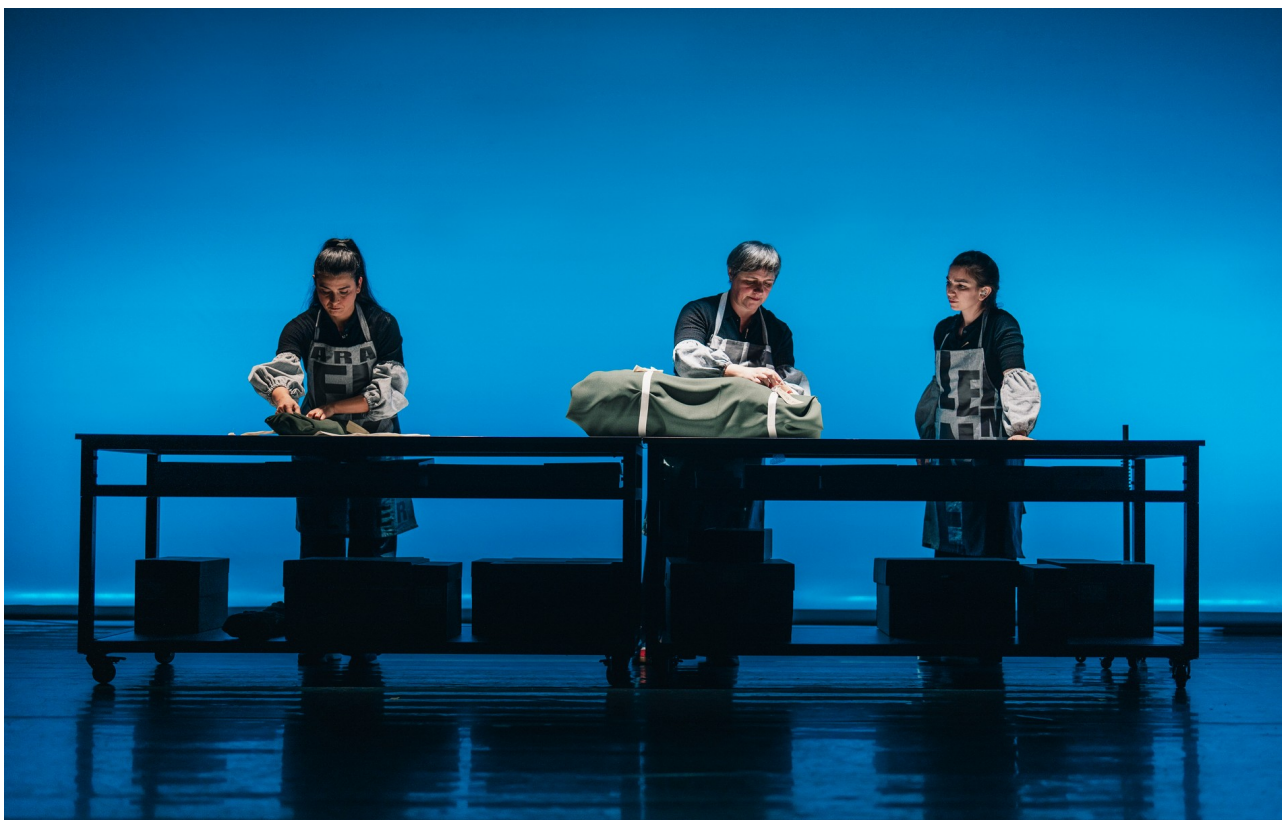
HELEN KELLER, ¿LA MUJER MARAVILLA?

Después de una serie de piezas que cuestionaron las narrativas oficiales a través de historias locales en las que se cruzan la memoria colectiva y la experiencia personal (Citizen, Eurozone, Fillas Bravas, Eroski Paraíso, Curva España, N.E.V.E.R.M.O.R.E.), este proyecto cuestiona nuestro modus operandi, con el objetivo de seguir desbordando los límites y las estrategias de las prácticas de teatro documento. Se aleja de las historias más o menos locales y de la mirada generacional, pero mantiene el interés por narrar desde las zonas de fricción entre la memoria colectiva y los relatos oficiales, usando la misma metodología de trabajo y las tácticas de creación propias.