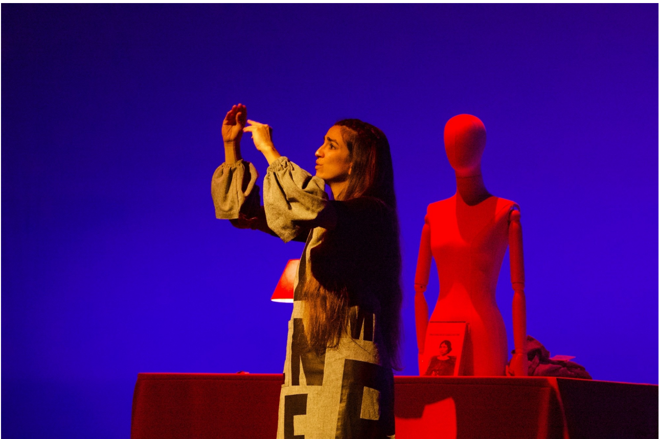
HELEN KELLER, A MULLER MARABILLA?