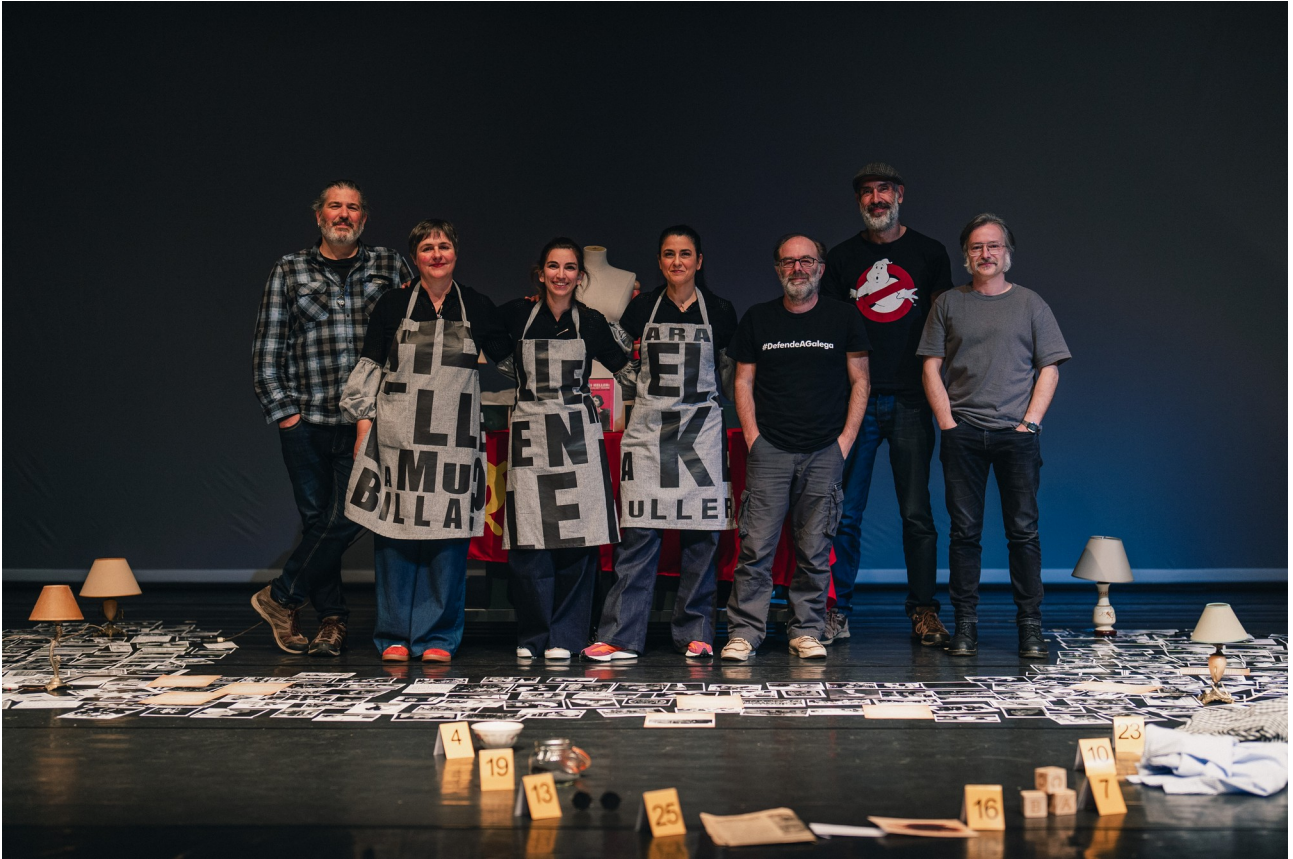
HELEN KELLER, ¿LA MUJER MARAVILLA? Parte del equipo