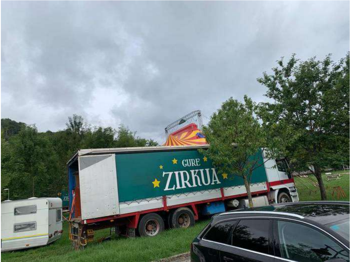
Gure Zirkukoen kamioia. (Onintza Lete Arrieta)