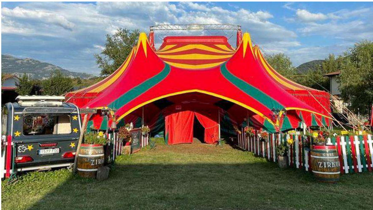
Carpa de circo de 'Gure Zirkua'

Desde aquel lejano 2018, Gure Zirkua no ha dejado de visitar Navarra cada año. Sin embargo, Tafalla y su comarca nunca había sido una parada en el camino. Hasta ahora. Y es que gracias a la apuesta decidida del Ayuntamiento de Tafalla, junto a la ayuda de la red Agerraldia, el primer circo itinerante completamente en euskera ofrecerá nueve funciones entre el 22 de septiembre y el 10 de octubre en el parking de la calle Paseo de la República, o 'La Morena'. En concreto, las sesiones serán los días 22, 23, 24 29