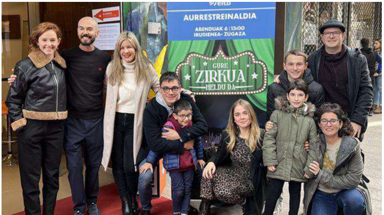
• "Gure Zirkua"ren aurkezpeneko irudia