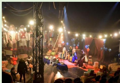
ERREGAEK - OLENTZERO