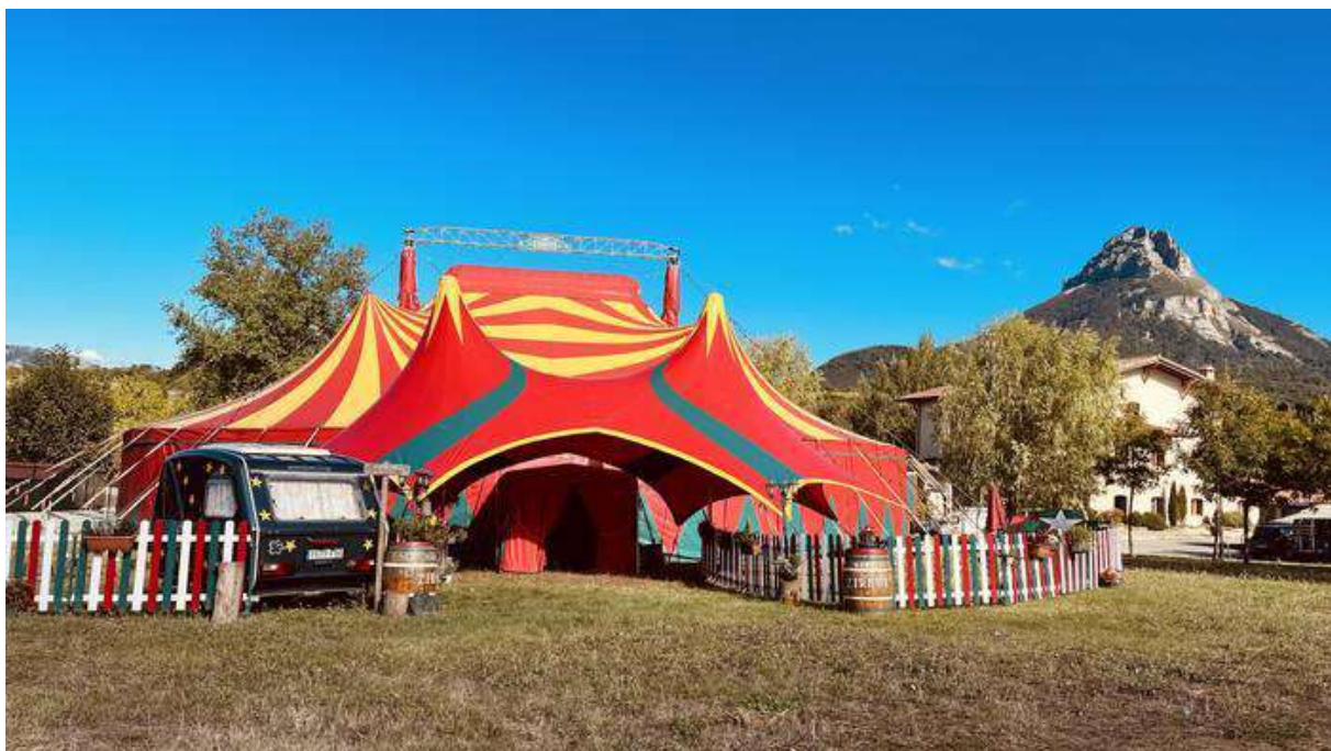
Gure Zirkuaren karpa Arbizun kokatuta dago. ANDONI IRAZUSTABERRENA