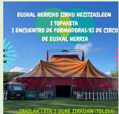
EUSKAL HERRIKO ZIRKUKO HEZITZAILEEN TOPAKETA - EZE