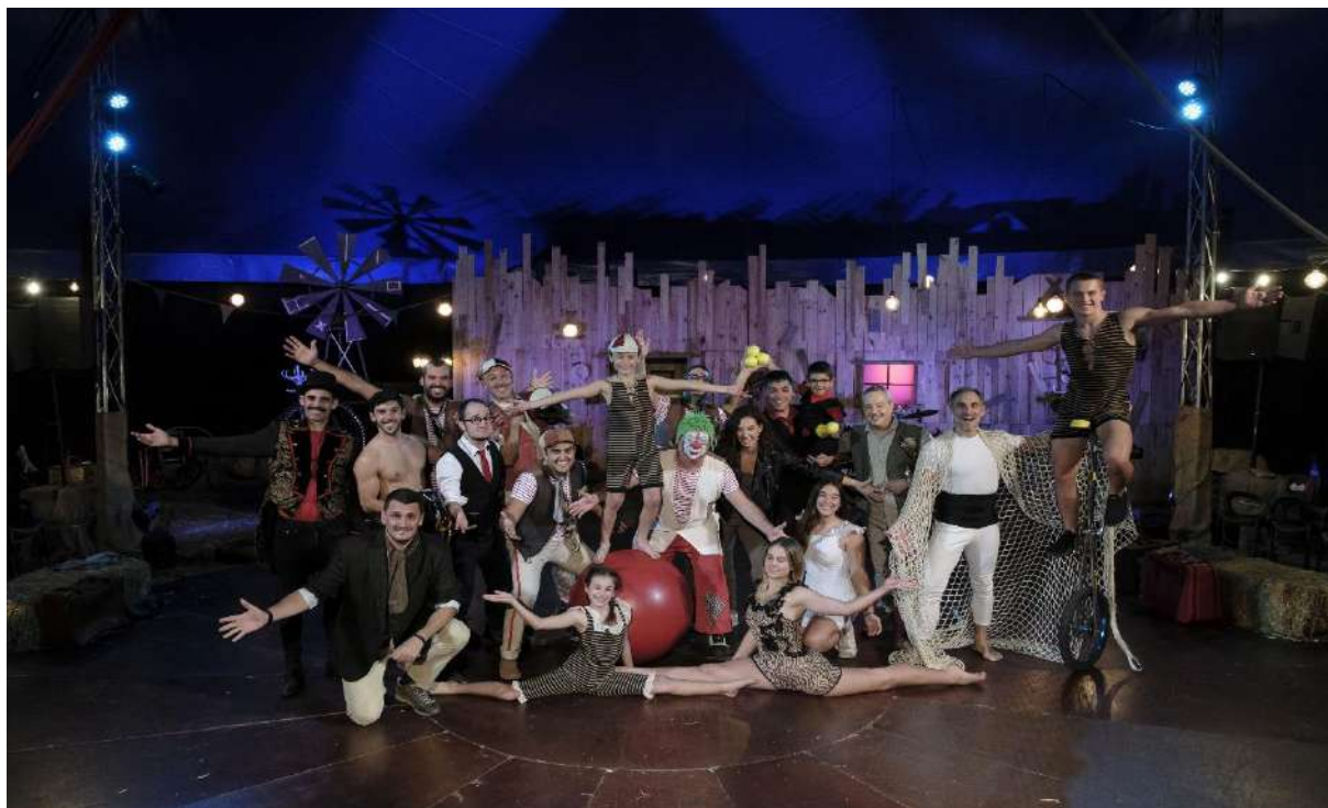
Gure Zirkuaren taldea, ETBren saioan. ETB

ETBk 'Gure Zirkua' estreinatuko du urtarrilean; lau atal izango ditu. Sua Enparantza zirkuaren atzean dagoena deskubrituz joango da.