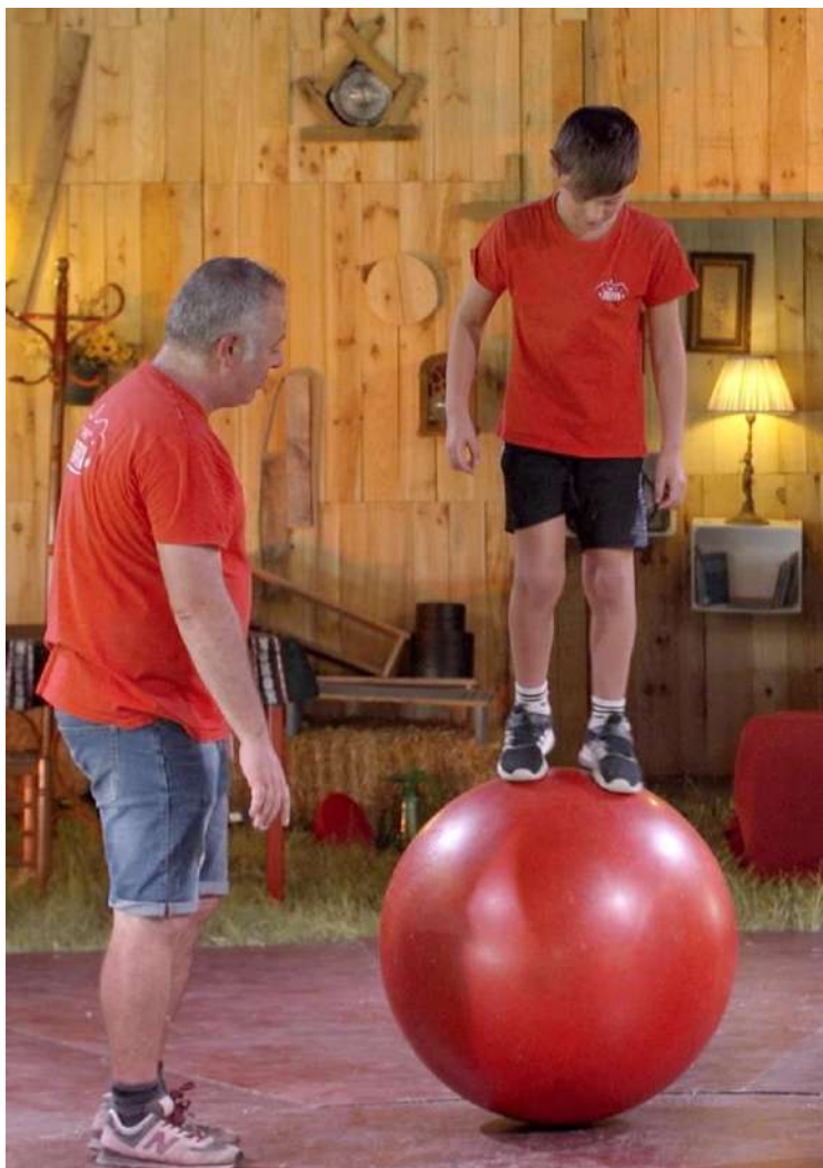
ETB1eko 'Gure Zirkua' saioa.