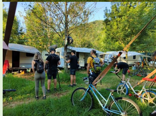
"GURE ZIRKUA HELDU DA" FILMAKETAREN IRUDIAK