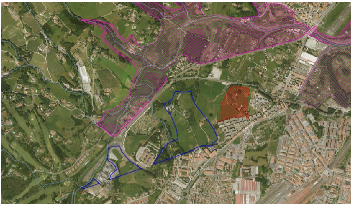
Imagen 2: En azul propuesta de AAEE contenida en la Alternativas 2 y 3, en rojo el ámbito residencial Karmeldarrak, previsto en las Alternativas 1 y 2. En rosa y verde la delimitación de la ZEPA y ZEC, respectivamente.

El documento inicial estratégico incorpora un apartado relativo a la potencial afección del Avance del PGOU de Hondarribia a la Red Natura 2000, en el que con respecto a las posibles afecciones de los desarrollos planteados en Urdanibia-Zubieta sobre la ZEC/ZEPA Txingudi, viene a señalar que si bien la afección a la calidad del hábitat del sapo corredor, el pez espinoso y la avifauna (elementos clave del espacio) se valora de magnitud significativa, las afecciones se producen fuera de la ZEC, concluyendo que no se causará perjuicio a la integridad de la ZEC.