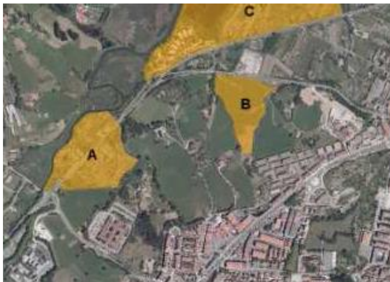
Imagen 3: Zonas de distribución del sapo corredor.

Los pólder agrícolas, que precisamente coinciden con las zonas inundables que constituyen a su vez las zonas de distribución del sapo corredor y las zonas de mayor interés para las aves ligadas al estuario, quedarían, sobre todo en el caso de la Alternativa 1, constreñidos entre desarrollos de actividades económicas y desarrollos residenciales. Si bien se trata de zonas fuera de la ZEC/ZEPA están íntimamente ligadas al espacio Natura 2000, de hecho las zonas de distribución del sapo corredor (elemento clave del espacio) se distribuyen a ambos lados de la carretera BI-636/N-638 (que ejerce de límite del espacio protegido).