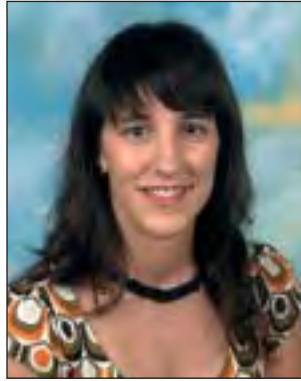
Musika Banda Amezti Gojenola Sagarzazu