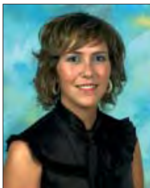
Arrantzaleen Kofradia Irati Oronoz Goikoetxea