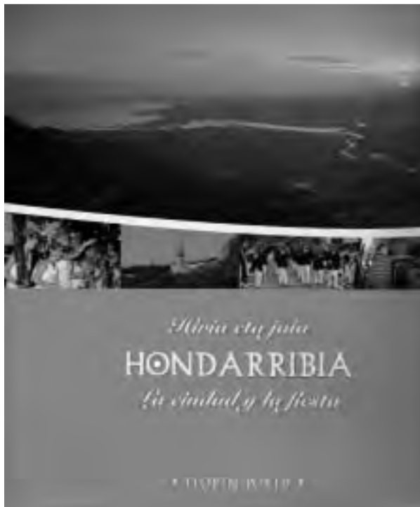
Floren Portu argazkilariaren liburuaren azala

Olearso liburudenda, Iza liburudenda, Susana liburuden-