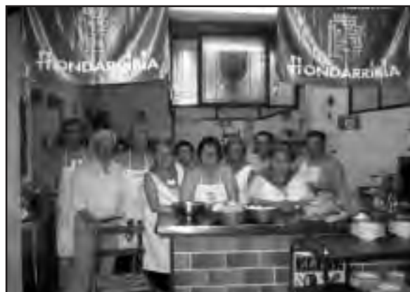
Klink Elkarteko kideek lan handia egin zuten bazkarian

Irudian agertzen den bezala, bazkari herrikoia Klink Elkartean ospatu zen, eta bertan izan ziren ehun bat zaletu. Jai giro ederra izan zen bertara joan zirenetako batzuk esan digutenez.