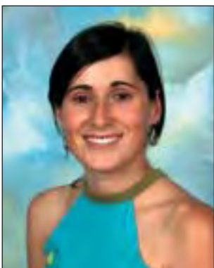
Artilleria Aroa Blanco Emazabel