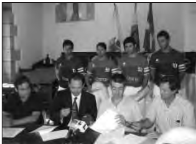
Aurkezpen ekitaldia egin zeneko irudi bat

baina antolatzaileek prezio ekonomiko bat jarriko dutela ziurtatu zuten.