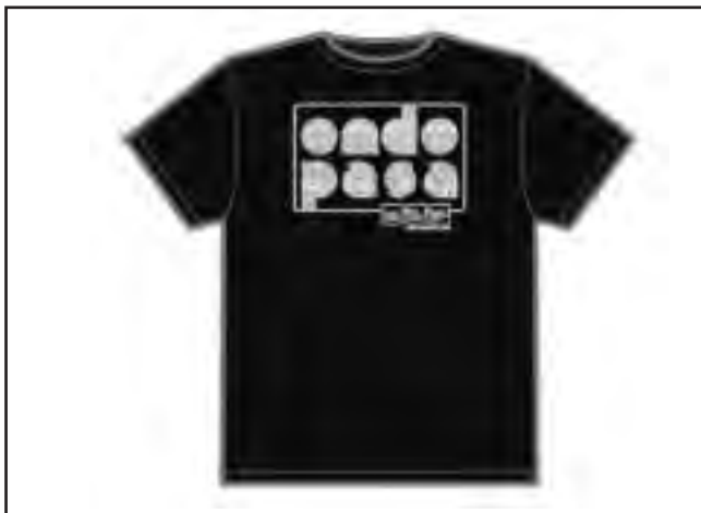
Kamisetak jaiak amaitu arte banatuko dira

railean ospatuko diren Jai Nagusiak direla eta, hirugarren urtez jarraian, Prebentzio Komunitarioko Udal Zerbitzuak kamisetak banatuko ditu. "Udan ondo pasa baina ez pasa" kanpainaren barnean dagoen ekimen bat da.