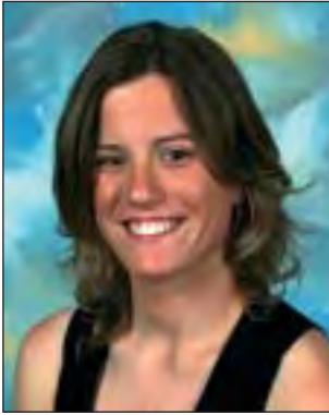
Danborrada Maddi Kanpandegi Mitxelena