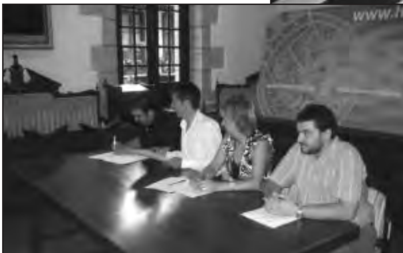
Akordioa Udaletxeko Areto Nagusian sinatu zen

raren aldeko apustu argia egin duela" esan du. "Urte eta erdiko lan sakon baten ondoren, akordioa sinatu dugu eta orain euskararen aldeko lanarekin jarraitu behar dugu".