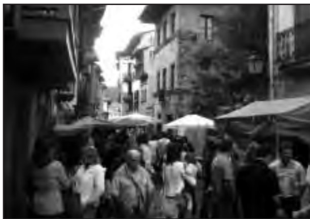
Jendeak eguraldi kaxkarrari aurre egin zion

Zenbait ekitaldi bertan behera geratu ziren