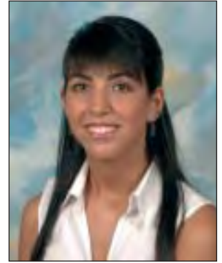
Zalditeria Aloña Aranburu Aizpitarte