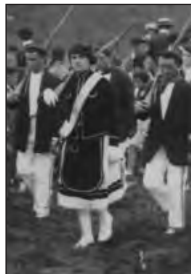
Kantinerak eskopetarekin joaten zireneko argazki bat