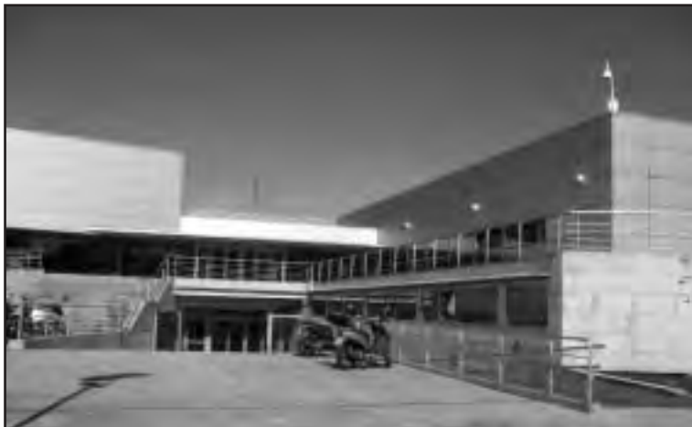
Ikastaroak Hondartza kiroldegian emango dira

8, 9 eta 10 urteko haurrei zuzentzen zaie