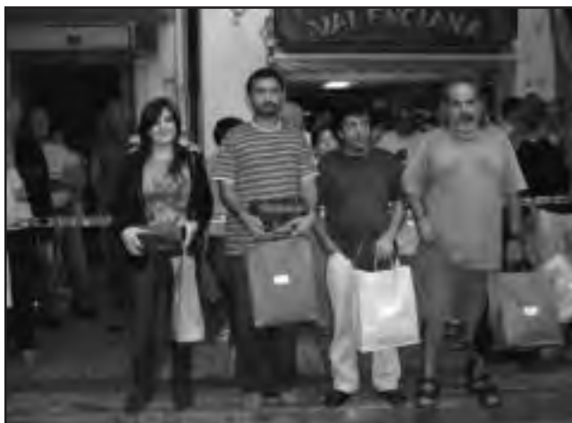
Aurtengo lehiaketaren garaileen irudi bat